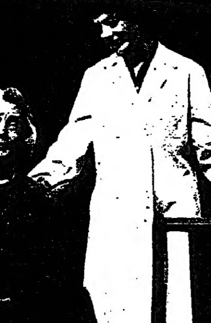
شكرا للحياة : صحتها الاخيرة

عاشق ؟ هات فتح الدواء ! وقل اني ينع في مجال الامراض ؟ اسقيت ارملة اقحاح وسمعت امي تقول - ليشتك هذا من الحب . وعشت عدة اسبوع على الأذى .. وانفض السبوع آخر ، وقررت ان اتايلها حتى ولم كانت ابنة شيطان رجيم . وكبرت في الاذهاب إلى القمي صباح يوم الاحد وجلست انظر حتى مرت الفتاة - وهي محبة - وربيتها في طرفها السي سيكية . ولحقت بها ، وكنت اشرب حتى اوشكت الرسالة التي كتبها بمتابفة ان تسقط من يدي ، وكانت تحوي في اشجار اخبرها بها اني اكاد اموت نسي هوما ، وانها لو ظلمت من ذنابها في السامة الثانية ، بعد منتصف تلك